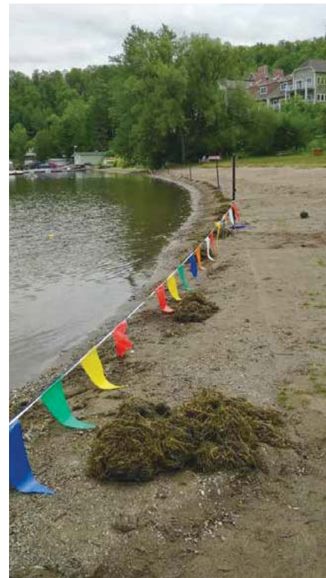
Myriophylle échoué sur la plage Massawippi en une seule journée d'affluence le 21 juillet : 16 amas de plus de 5 kilos chacun.

On comprendra d'emblée que les centaines de milliers de tiges qui flottent, coupées par les bateaux, s'installent dans tous les secteurs du lac. D'où l'établissement des zones sensibles dans le cadre du projet Nautisme Intelligent : le myriophylle atteint souvent plus de 5 mètres, plaisanciers, évitez à tout prix les herbiers (zones rouges sur l'application Ondago).