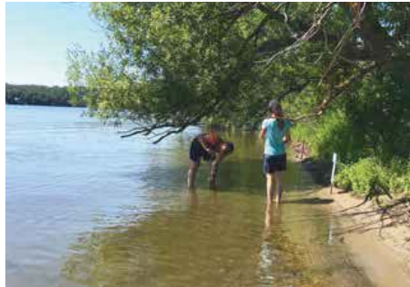
Suivi des stations d'érosion, Ayer's Cliff, juillet 2018

Depuis maintenant près de 10 ans, Bleu Massawippi administre au moins un grand projet spécifique d'envergure permanent avec le soutien d'un financement public. Le projet Nautisme Intelligent est à sa deuxième année (voir la page 3)