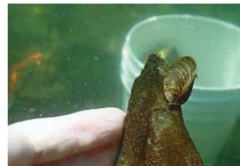
Moule zébrée du lac Memphrémagog, 20 juillet 2018

Bleu Massawippi entreprendra dans les prochaines semaines des recherches à des stations spécifiques. Souhaitons que nous soyons encore épargnés. Quoiqu'il en soit, il faut dès à présent, collectivement, revoir nos méthodes, ne tolérer aucun laxisme, appliquer très strictement les règles de lavage et surtout interdire tout accès non contrôlé au lac.