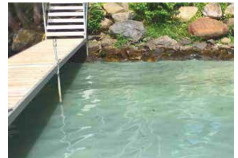
Éclosion d'algues bleu-vert 13 juillet Baie Morse

Bien que moins populaires dans les médias, les algues bleu-vert sont encore présentes dans le lac Massawippi. Bleu Massawippi via sa patrouille assure une veille constante pour détecter les éclosions et effectuer les démarches nécessaires. Par ce bel été chaud, il y a des cyanobactéries dans la colonne d'eau un peu partout, depuis le 24 juin. Une grave éclosion a frappé la Pointe Noire, les baies Morse et Baltimore, les 13 et 14 juillet derniers. Dans les circonstances, Bleu Massawippi a recommandé d'éviter la baignade, les sports nautiques et de protéger les animaux domestiques dans ces secteurs. Rappelons que le contact avec les algues bleu-vert peut causer des problèmes de santé immédiats. Nous inspectons quotidiennement. Nos alertes apparaissent sur Facebook.